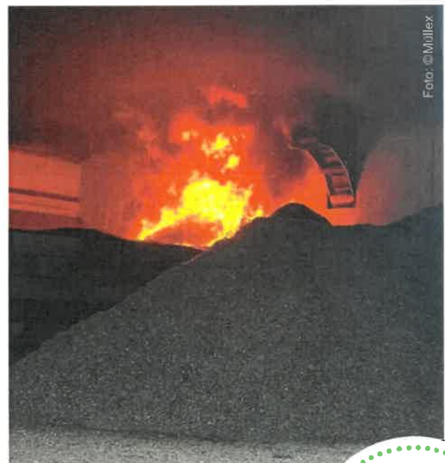
Brand in einer Verwertungsanlage

SPRAYDOSEN (DRUCKGASPACKUNGEN): Nur komplett LEERE Spraydosen dürfen in die Metallverpackungssammlung (Blaue Tonne), ansonsten bitte unbedingt ins Altstoffsammelzentrum!